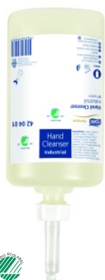
Tork Premium průmyslové tekuté mýdlo – Tork Premium Industrial Hand Cleanser

V průmyslovém prostředí je důležité mít systém mytí a čištění rukou s vysokou efektivitou a vždy po ruce. Prostředek na mytí rukou si musí poradit s odstraněním silné špíny, olejů a mastnoty z pokožky. Tam, kde není možné použít vodu, se k čištění rukou skvěle hodí vlhčené utěrky.