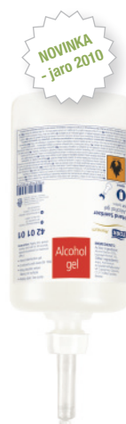
Tork Premium Alcohol Gel - dezinfekční prostředek – Tork Premium Alcohol Gel Sanitizer