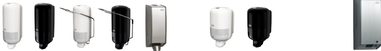
Zásobníky na tekuté mýdlo - Systém S1