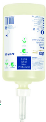
Tork Premium extra jemné tekuté mýdlo – Tork Premium Soap Liquid Extra Mild

Ve zdravotnických zařízeních je hlavní prioritou minimalizace rizika šíření bakterií. Patrná je rovněž snaha o zajištění hygienických, čisticích a dezinfekčních prostředků šetrných k lidským rukám. Důležitý je výběr mýdel a dezinfekčních prostředků, které maximálně sníží riziko alergických reakcí, ale zároveň pokožku přijatelným způsobem hydratují a obnovují její přirozenou rovnováhu.