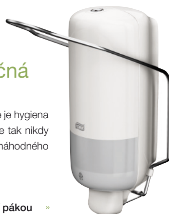
Tork Elevation zásobník s loketní pákou »

Pro zdravotnická zařízení a závody na zpracování potravin, kde je hygiena vždy hlavní prioritou, zvolte zásobník s loketní pákou. Nedojde tak nikdy ke kontaktu rukou se zásobníkem. To minimalizuje riziko náhodného přenosu bakterií.