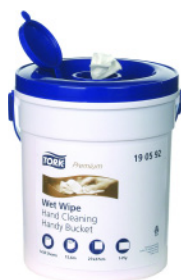
Tork Premium vlhčené utěrky na ruce – Tork Premium Wet Wipe Hand Cleaning